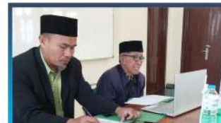
Ujian Masuk PUTM