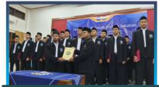
Serah Terima Jabatan IMTM