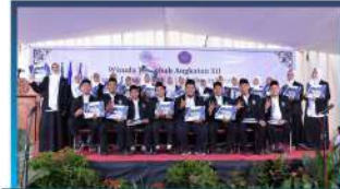
Pelepasan Thalabah Pengabdian