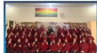
PUTM Peduli Qurban