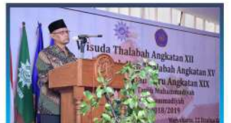
Wisuda Thalabah PUTM