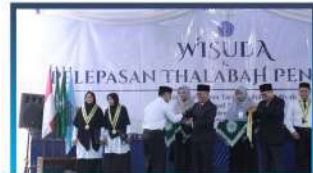
Wisuda Thalabah PUTM