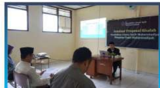
Sidang Proposal Risalah