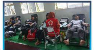
IMTM Donor Darah