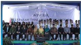
Wisuda Thalabah PUTM