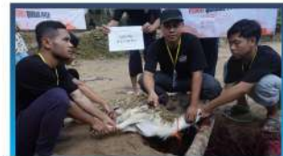
PUTM Peduli Qurban