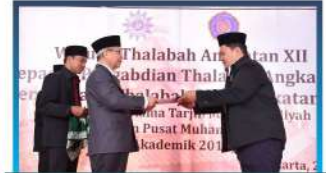
Pelepasan Thalabah Pengabdian