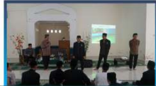
Pembekalan Mubaligh Hijrah