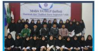
Masa Ta'aruf Thalabah Baru