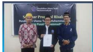
Sidang Proposal Risalah