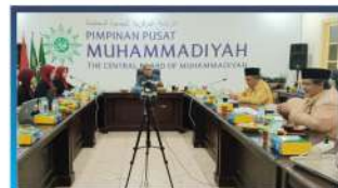
Sidang Fatwa Tarjih