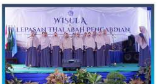
Tim Paduan Suara PUTM