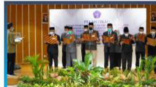
Pelantikan BPH PUTM